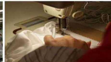
サンプル縫製部門