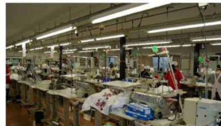
工場内様子 立ちミシンTSS生産方式多能工生産システム