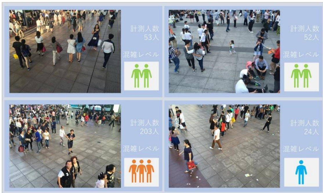
(図 1) モニタリング画面イメージ