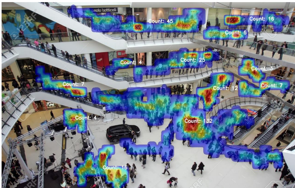
(図 3) 映像解析結果のイメージ

本システムの導入により、入場者数や混雑状況の把握に要するモニタリング業務のコスト削減や、定量的な混雑状況の把握で施設内の誘導員等の運用改善も期待しております。