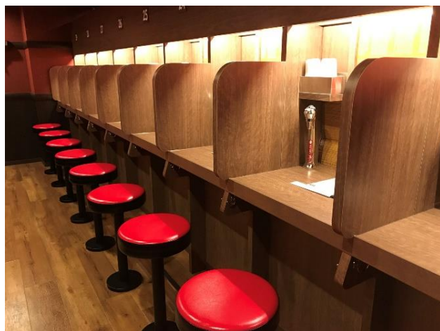
味集中カウンター ※イメージ