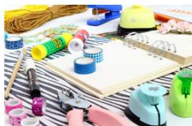
ホームデコレーション