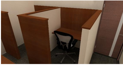
3F 半個室型サイレントブース