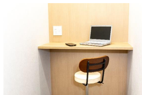
2F 完全個室型 テレフォンブース

新型コロナウイルスの影響を受け、利用者が安心して施設を利用できるよう、隣の席と仕切られていない席には「アクリル板の間仕切り」を設置します。その他にも、入退室時の消毒液や除菌シートの設置、マスク着用やこまめな換気をお願いを継続して行っています。