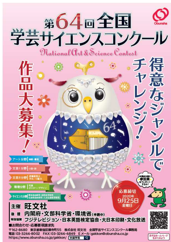
■第64回全国学芸サイエンスコンクールポスター

また今年は、新型コロナウイルスの影響により、自宅でできることなど、新しい学習に取り組んでいる子どもたちも多いと思われます。そのような学習の発表の場としてもぜひ、学コンを活用していただければと思います。