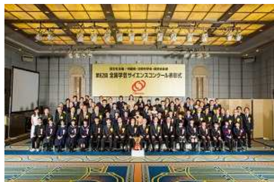
■第62回表彰式(ホテルオークラ東京にて)