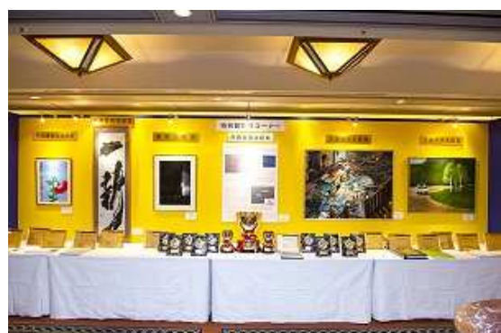
■第62回特別賞展示(表彰式会場)