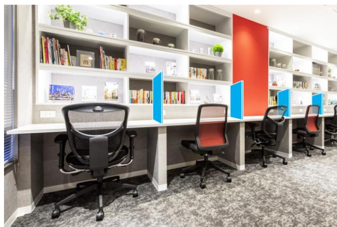
▲パーテーション（イメージ図）