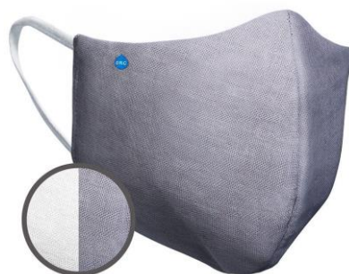
「ハイドロ銀チタン®ソフトガーゼマスク」 グレータイプ