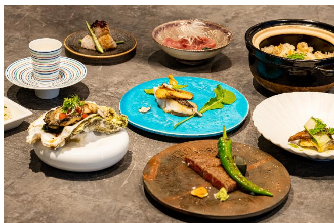
旬の食材を活かした「紡 Dining」ディナーコース（一例）