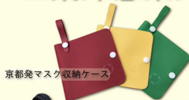
京都発マスク収納ケース