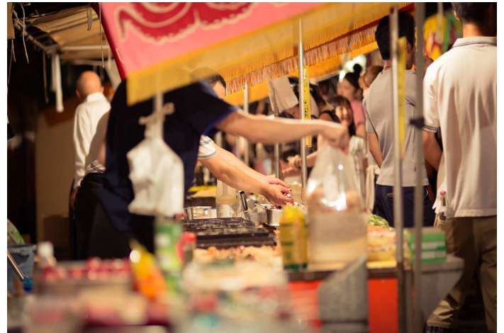
画像左から：キャンペーン POP（お好み焼き・ソフトクリーム）、お祭りの屋台イメージ画像

東京都の休業要請緩和『ステップ3』を受けて、改めて店内における感染症予防の徹底と、新型コロナウイルスとともに生きる『ウィズコロナ』という新たなステージでのネットカフェの在り方を考え、安心して過ごせるインターネットカフェとして力をいれています。感染症対策については2ページ目の対策一覧をご参照ください。