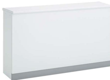
⑦ 受付カウンター：1台