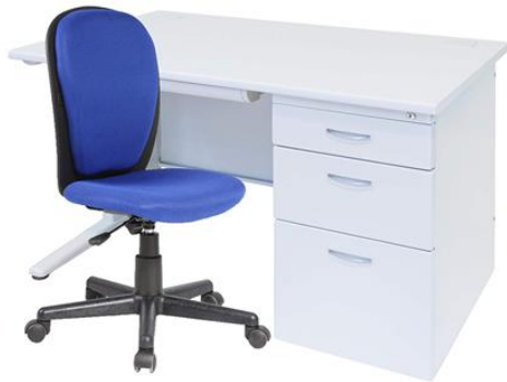
⑥ 教師用机・椅子：1セット