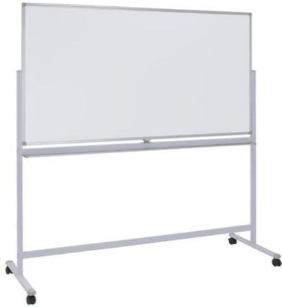
④ ホワイトボード：1台