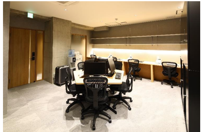
京都駅から徒歩 5 分の新社屋