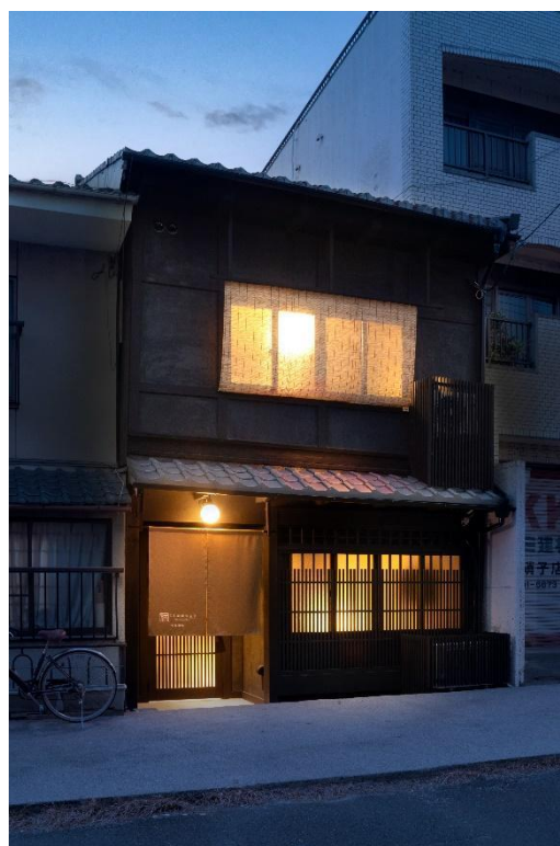
歴史ある街並みにも溶け込む外観