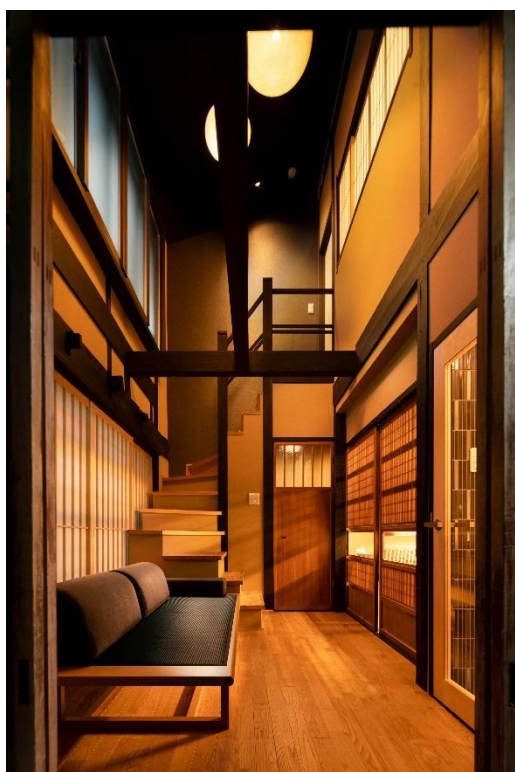
年代物の梁や柱はあえて見せる作り

当社は2016年4月の起業時より「人を結び 街を紡ぐ」をコンセプトに、京町家の保存と再生・活用をする取り組みに力を注いでいます。伝統的な構法を用いた家屋である「京町家」は築100年以上経つ建物が多く、京都の歴史情緒を感じさせてくれます。しかし、所有者の高齢化やそれに伴う相続問題、加えて独特の形状の間取りのため修繕が難しく、一日に約2軒のペースで「京町家」は取り壊されているのが現状です。また放置されたままの空き家は倒壊の恐れや街の景観を損なうことに繋がり、街としてのブランド価値を下げる要因になりかねません。当社は多くの文化的価値を持つ「京町家」を次の世代に受け継ぐべきものであると考え、外観や内観の趣や意匠をできるだけ残し、一日一組限定の一棟貸し宿泊施設として再生する取り組みを行っております。デザインや施工、運営管理、清掃まで一貫してトータルサポート出来ることが当社の強みであり、宿泊していただくゲストには京町家に泊まるという特別な体験を、そして地域社会には街の再生や活性化という形で貢献していきたいと考えています。