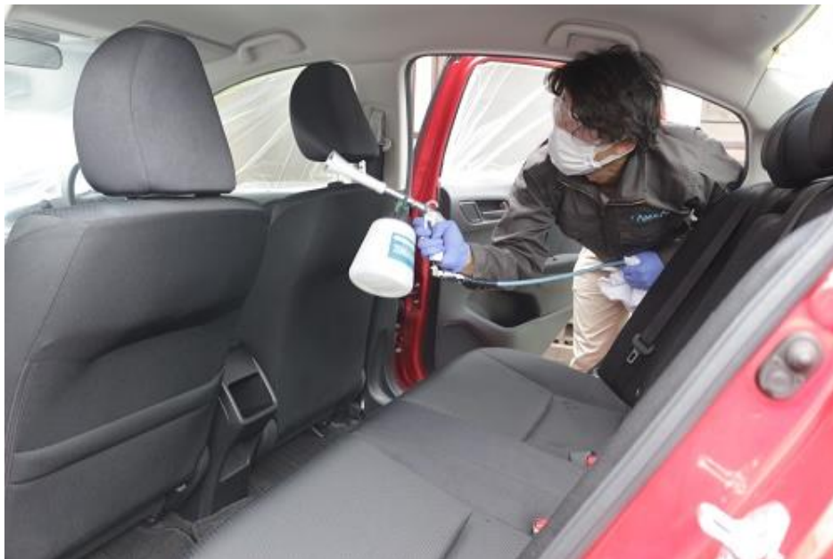
抗ウイルス抗菌コーティング(「レコナガード エアリフレッシュ」) 教習車内の施工の様子