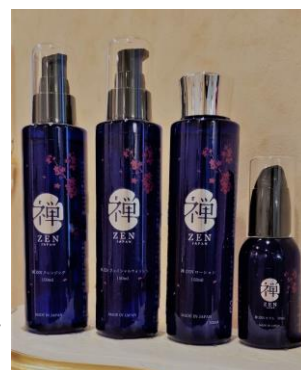
禪 SPA オリジナル『禪=ZEN=』