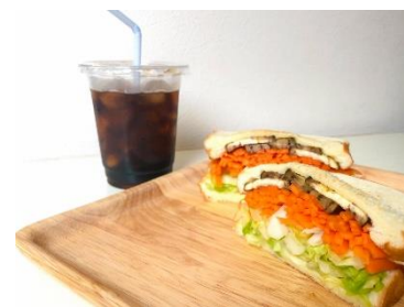
アイスコーヒーとベジサンドセット

当カフェは、サンカクシャのサポートのもと、アルバイト経験のない若者でもお互い教え合いながら働ける環境を目指しています。メニューは、ドリンクをコーヒーや紅茶、スムージーなど、フードをサンドイッチなどに限定し、作業工程のオペレーションを簡素化しています。また、フードロスの削減に注力し、素材の使用方法や提供方法を工夫しています。例えば使用する野菜や果物は、その日の材料内でサンドイッチやスムージーを作り、サンドイッチは 1 日 20 食限定とするなど、廃棄を減らすための工夫をします。