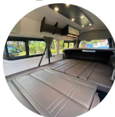
就寝・休憩モード