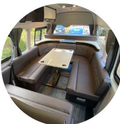
打ち合わせ、テレワークモード