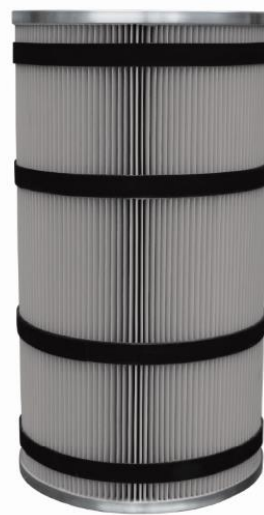
当社独自のブリーツ成形フィルター