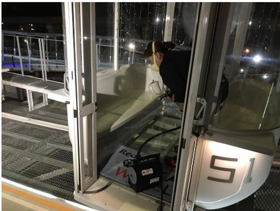
抗ウイルス抗菌コーティング（「レコナガード エアリフレッシュ」） 観覧車の施工の様子