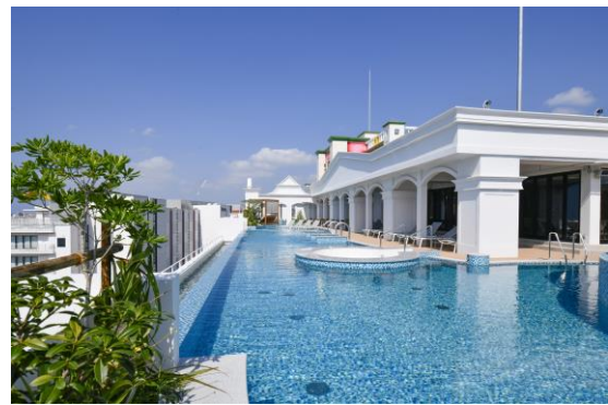
ハワイアンスパ『SPA SOLANI OKINAWA CHATAN』内観（左） 『SPA SOLANI OKINAWA CHATAN』がオープンするバーデゾーン（右）