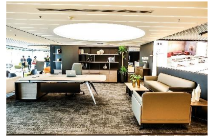
杭州旗艦店イメージ 店舗面積: 1400 m 2