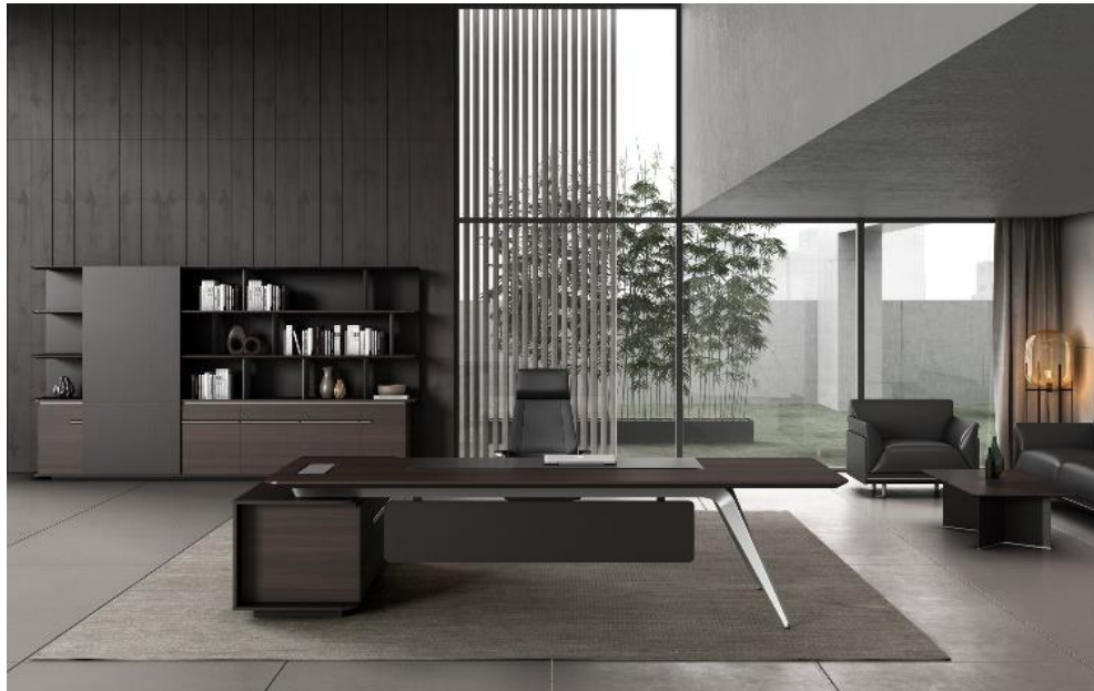
(製品例)Prime series のデスク シンプルモダンの美を表現しながら、剛と柔を同時に表現