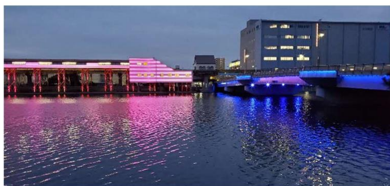
駅舎・勝島橋のライトアップ