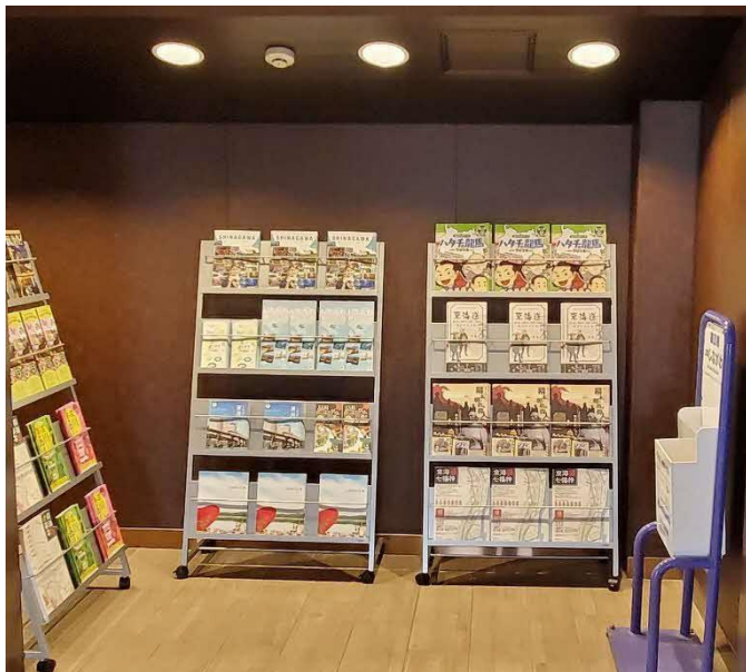
大井競馬場前駅 構内『しながわ観光情報コーナー』

品川区としながわ観光協会は、2020 年 8 月 3 日（月）にリニューアルオープンされた東京モノレール・大井競馬場前駅の構内に、8 月 6 日（木）13:00 より『しながわ観光情報コーナー』を開設することを発表します。