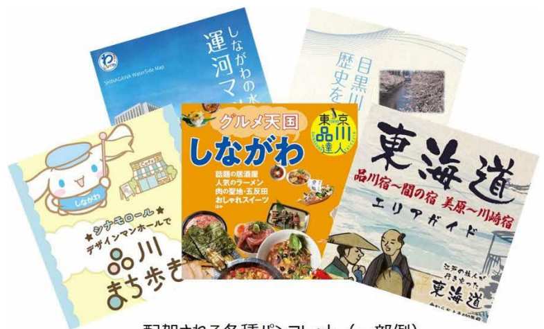
配架される各種パンフレット（一部例）

『しながわ観光情報コーナー』は、大井競馬場前駅周辺や品川区観光マップなど区内のおすすめ観光スポットのパンフレットを配架し、各種情報を発信します。