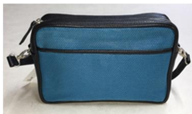
民谷螺鈿(株) レザーシルクポーチバッグ