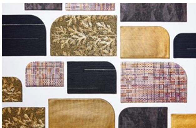
TANGO CREATION PLATFORM カードケース (大・中・小)