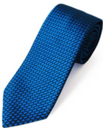
クスカ(株) ガルザタイ (丹後ブルー)