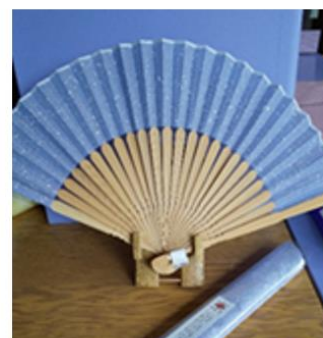
田勇機業(株) 正絹紵扇子