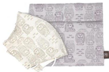
(株)吉村商店 アマビエシルクマスク マスクケース