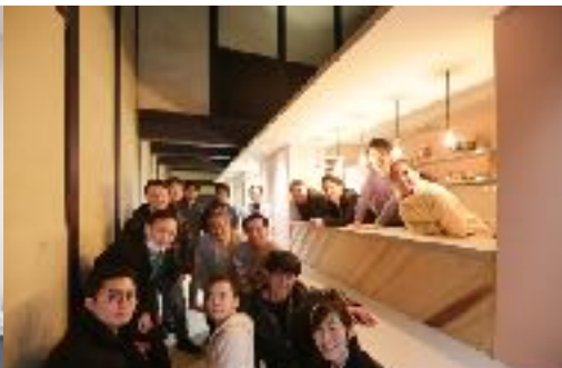
徳島県美馬市スタディーツアー