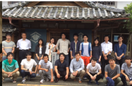
徳島県美波町スタディーツアー