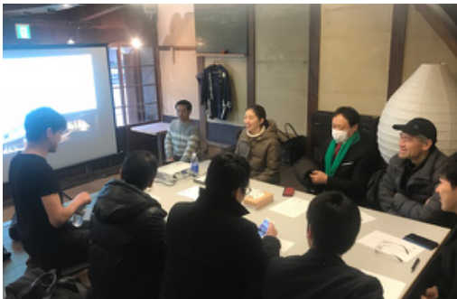
徳島県美馬市スタディーツアー

都市部経営者やビジネスマン、学生が参加。 スタディーツアーを機に移住しての起業者も。