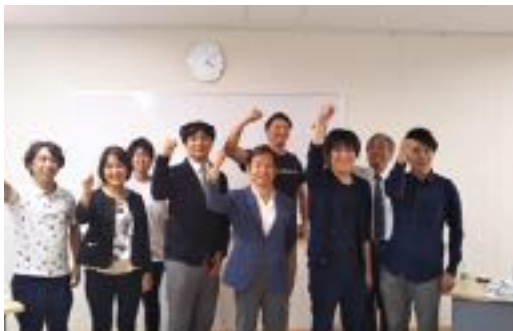
熊本県菊池市スタディーツアー