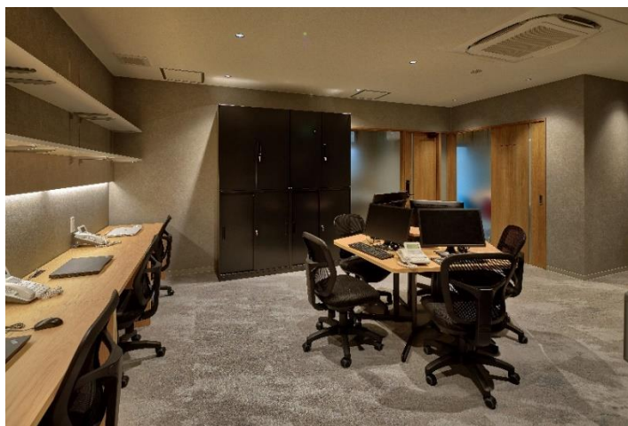
2020 年 7 月に移転した京都駅前新オフィス

当社は 2016 年 4 月の起業時より「人を結び 街を紡ぐ」をコンセプトに、京町家の保存と再生・活用を通じて京都の未来を紡ぐ担い手となることを目指し、事業に取り組んでいます。多くの文化的価値を持つ「京町家」を次の世代に受け継ぐべきものであると考え、外観や内観の趣や意匠をできるだけ残し、一日一組限定の一棟貸し宿泊施設として再生する取り組みを行っております。（現在京都市内で 51 棟を管理運営）デザインや施工、運営管理、清掃まで一貫してトータルサポート出来ることが当社の強みであり、宿泊していただくゲストには「京町家に泊まる」という特別な体験を、そして地域社会には「街の再生や活性化」という形で貢献していきたいと考えています。