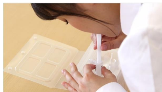
少量の唾液を採取する

■ふるさと納税返礼品として先着 1,000 名限定出品（2021 年 3 月末まで）