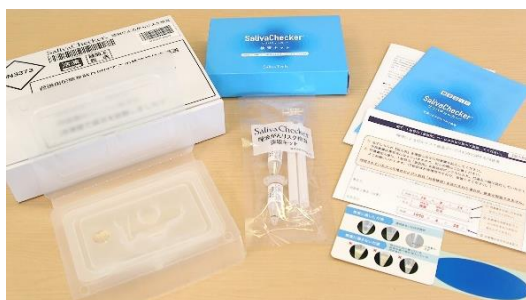
膵がん、肺がん、大腸がん、乳がん、 口腔がんのリスクを測定

* 本検査のみでがんにかかっているかどうかを確定することはできませんので、本検査を受けた場合でもがんの確定診断には従来型のがん検診・検査を受ける必要があります。