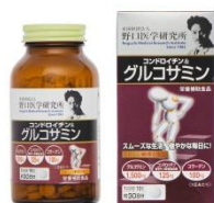
コンドロイチン & グルコサミン 価格 1,980円