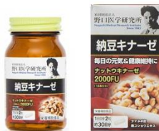
納豆キナーゼ 価格 2,980円