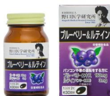
ブルーベリー & ルテイン 価格 2,980円