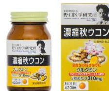
濃縮秋ウコン 価格 1,580円