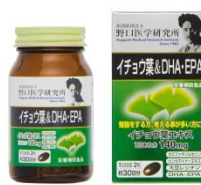
イチョウ葉 & DHA・EPA 価格 2,580円