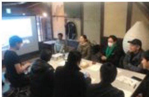
徳島県美馬市スタディーツアー

都市部経営者やビジネスマン、学生が参加。 スタディーツアーを機に移住しての起業者も。