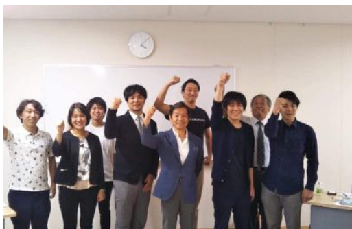
熊本県菊池市スタディーツアー