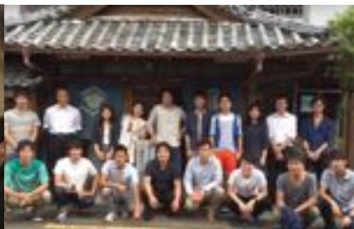
徳島県美波町スタディーツアー