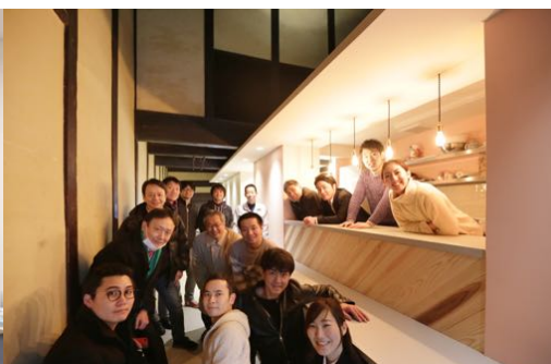
徳島県美馬市スタディーツアー