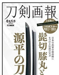
▲刀剣画報 vol.1 髭切・膝丸と源平の刀