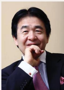
竹中平蔵 経済学者 慶應義塾大学名誉教授