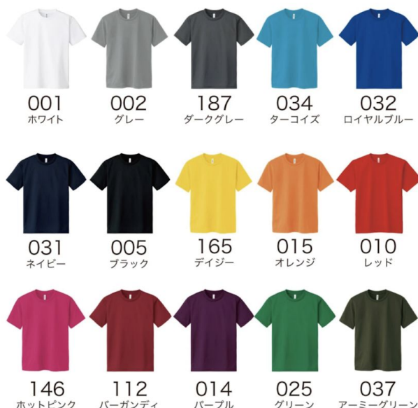
カラーバリエーション