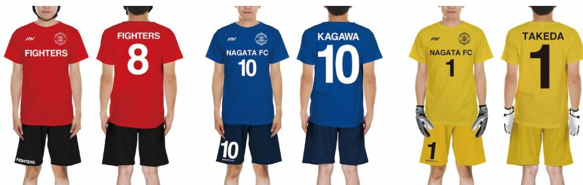
1) ラグビー オリジナルオーダー ユニフォーム

https://artworks-kobe.com/products/orit00300act-soccer-gk-1