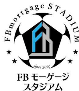
FB モーゲージスタジアム ロゴマーク