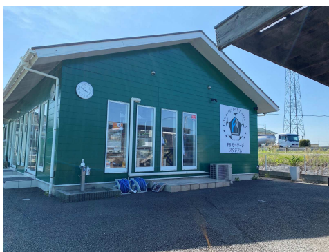
冷暖房付き休憩所