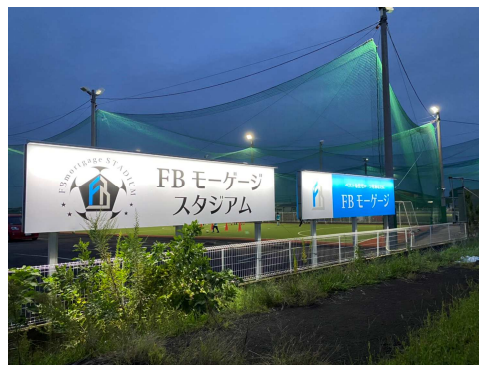
FB モーゲージスタジアム看板