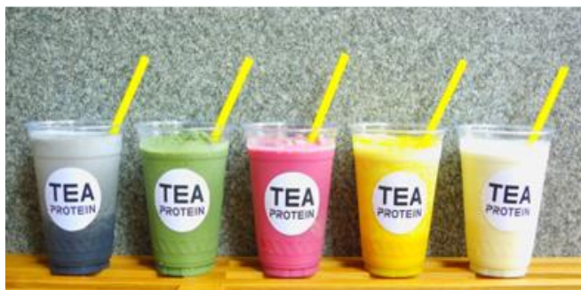
プロテインドリンク／各 ¥ 850 (税込)

『Well-being』をコンセプトに、健康で毎日イキイキした生活を目指したカフェを田町駅から徒歩3分のオフィス街に新規オープンいたします。