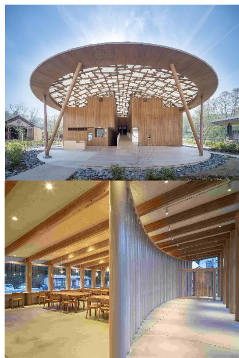
クアパーク長湯 施設写真

当社は今後も、様々な人が重炭酸泉温浴を健康改善のために活用できる環境づくりに励み、地域振興の一助となるべく尽力してまいります。