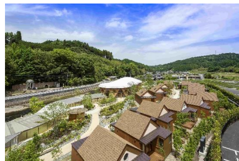
クアパーク長湯 全景

※4 医療費控除の申請には事前の手続きなど諸条件があります。詳細はお問い合わせください。竹田市温泉利用相談室 電話 0974-75-3688