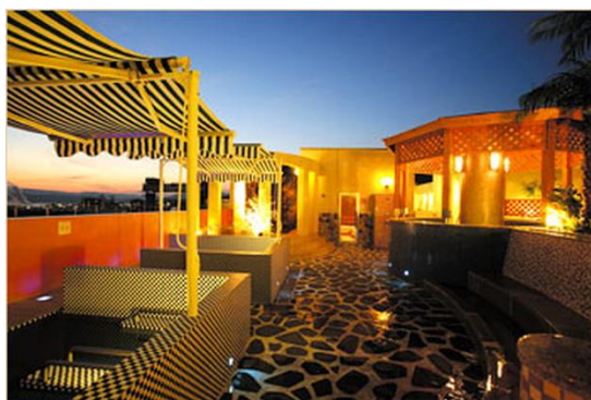
内湯・露天計 22 種類のお風呂。源泉かけ流し風呂も！

ホテルスパ事業を行なう株式会社クレドインターナショナル（本社：東京都中央区、代表取締役社長：白井浩一）は、広島県呉市に温浴施設『SPA SOLANI 大和温泉（スパソラニ やまとおんせん）』を 11 月 1 日プレオープンしました。22 種類のお風呂、7 種類のサウナ、3 種類の岩盤浴のほか、アジア、ヨーロッパ、ハワイアンなど世界中のリラクゼーションが堪能できるスパを併設しています。