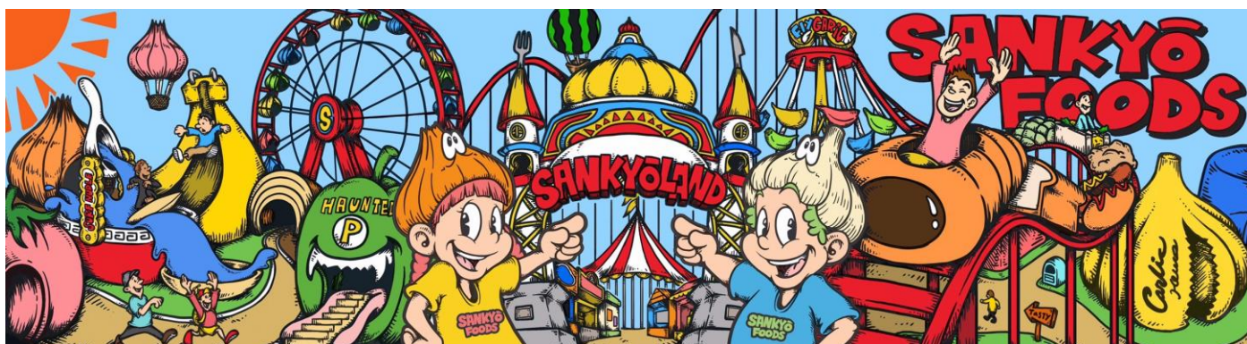
夢のワンダーランド・三共食品プロデュースの食のテーマパーク「SANKYO LAND」の案内人を務めるキャラクター2 人

（三共食品キャラクターネーミング応募サイト： https://www.koubo.co.jp/lp/sankyo-foods/naming/ ）