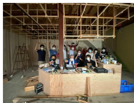
DIYで拠点整備をする様子

施設は、休憩やコミュニケーションの場となる「みんなの縁側」、ギャラリー兼セレクトショップの機能をもつ「みんなのお店」、ワークショップやレンタル作業場「みんなの作業場」など多くの機能を有しており、 用途に応じて様々な活用ができる ようになっています。