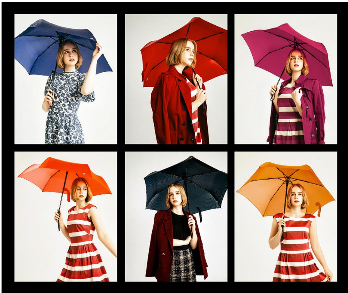
左上:ミッドナイトブルー 真ん中上:ワインレッド 右上:ドライローズ 左下:コーラルレッド 真ん中下:クラシックブラック 右下:カンタロープ

Makuake での先行販売キャンペーンは 12 月 9 日まで。3 本セットで最大 25%OFF！1 本でも数量限定で 20%OFF の特別キャンペーンです！