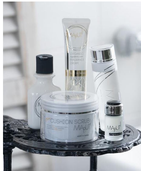
『MAPUTI』ボディケアシリーズ

同店舗は、ブランドカラーである白を基調とし、一足早いクリスマスのワクワク感をゴールドやシルバーで華やかに演出した、スタイリッシュで高級感のある『MAPUTI』の世界観を体感できる店舗になっています。