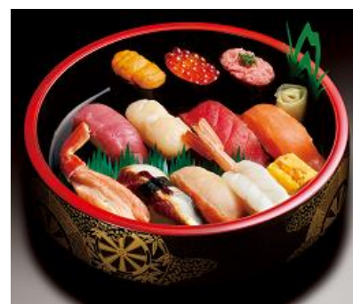
本マグロ中トロを使用した贅沢な一桶

商品についてのお問い合わせ先：ライドオンエクスプレスお客様相談室 0120-594-096