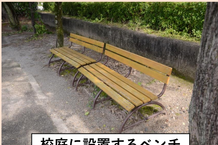
校庭に設置するベンチ