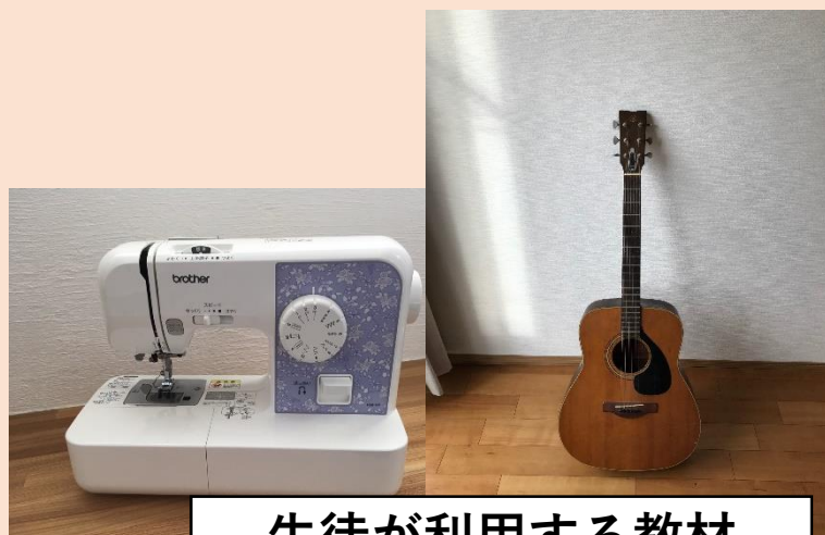
生徒が利用する教材