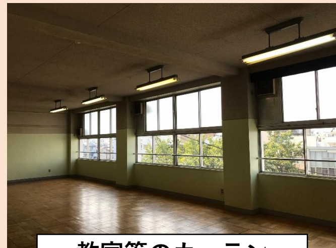
教室等のカーテン