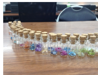
↑ 1万円以上のご購入者様へ 先着250個用意の小瓶入り 宝石のプレゼント