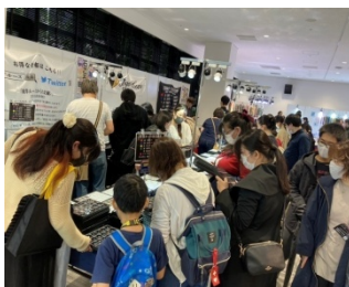
↑ 通常の共同開催での展示 販売会の様子 (どうしても密になってしまう)