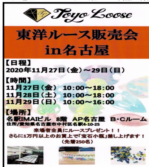
↑ 東洋ルース販売会in名古屋のポスター

今回、初開催となる単独販売会では、通常当社の出展している展示即売会の会場に比べ、 3密を避けるため、窓を全開で換気の出来る広い会場での開催 になり、従来の展示即売会よりも、入場可能人数も多く、安心して商品を見て頂けるのではないかと考えております。(東洋ルース販売会in名古屋の詳細については次ページに記載)