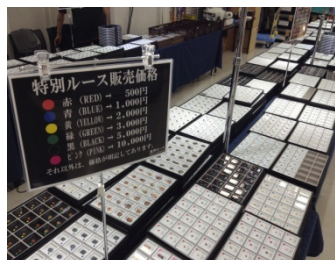
↑ 多数の商品をご用意