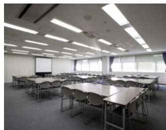
↑ 今回の単独販売会の会場 窓開放可能なだけでなく、 安心の広い空間での開催