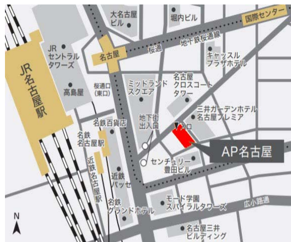
↑ AP名古屋へのアクセスマップ