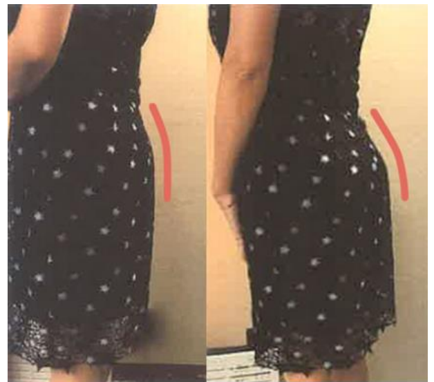
左：通常下着着用時 右：『SKINHIP』着用時