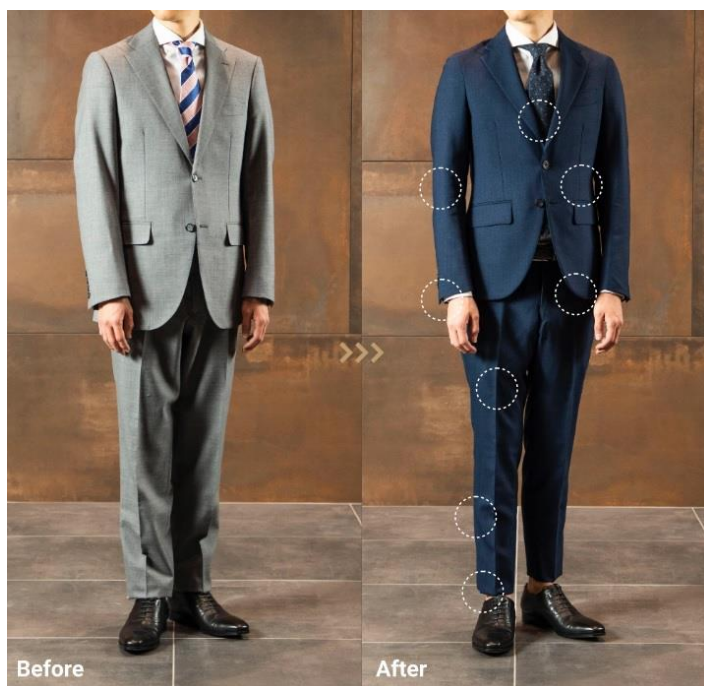
バスト、ウエストに合わせて余計なゆとりを削り、スリムなフォルムに変換