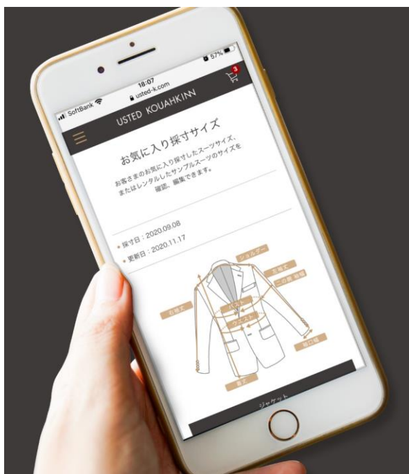
採寸したサイズはスマートフォンでいつでも確認