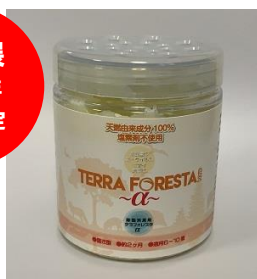
TERRA FORESTA α (テラフォレスタアルファ)