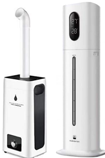
TERRA FORESTA Mist (テラフォレストミスト) あらゆる空間を除菌・消臭するミストタイプ