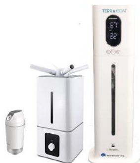
TERRA FORESTA Mist (テラフォレスタミスト)