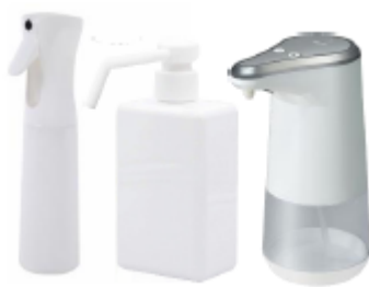
TERRA FORESTA Spray (テラフォレストアスプレー)