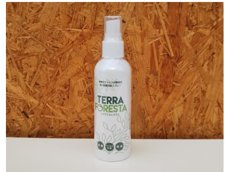
TERRA FORESTA Handy (テラフォレストハンディー) 日常生活で手軽に使えるミニボトルタイプ