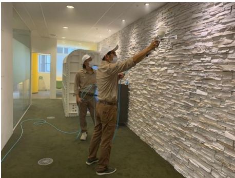
TERRA COAT (テラ・コート) 施工作業の様子