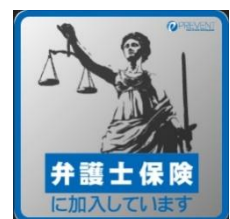
右:弁護士保険ステッカー

じく、加入者に配布しているリーガルカードを携帯して相手に見せて、セクハラやパワハラなどのトラブルへの抑止力として。また、玄関にリーガルステッカーを掲示することで悪質な訪問販売などへのトラブル抑止力としての効果も期待できるのも強みのひとつです。