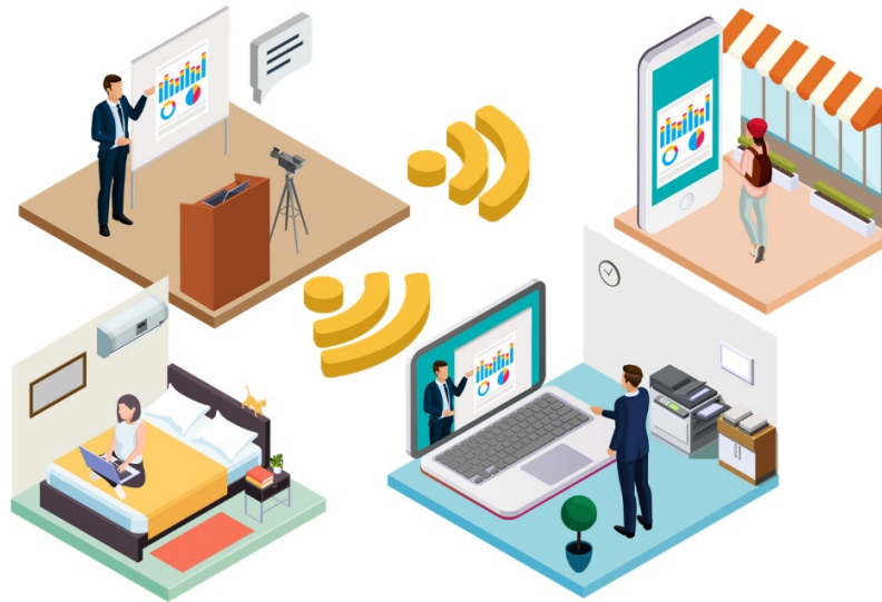
ライブ動画配信のイメージ

自社が所有するオンラインサロンにおいて、利用者にライブストリーミングで動画を配信できる機能です。