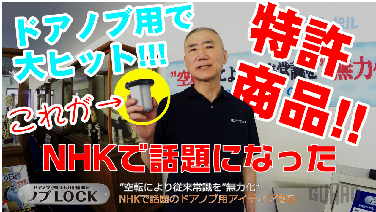
動画 TOP サムネイル

ビドーパルはガードロックと製品解説動画を共同制作しました。動画には製品開発者が自ら出演。ガードロックが保有する特許や製品の特長・利点をなど、詳細に分かり易く解説しています。是非ともご覧ください。