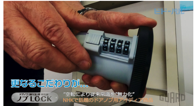
「ビドーパル動画 ガードロック - ノブ LOCK(商品解説編)」のキャプチャ画像