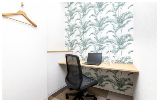
レンタルオフィス（1名用）※イメージ

通常のオフィスを借りると保証金や敷金がかかりますが、当施設のレンタルオフィス『BIZcircle』では一切不要。テレワークや個人事業主の方におすすめの1名用と、スタートアップや広い部屋を希望の方にぴったりの2名用も用意しました。ネット環境を完備しているため、PCひとつですぐに使えるのも魅力です。※別途契約金が必要です。