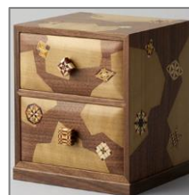
箱根寄木細工(神奈川)