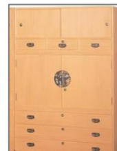
春日部桐箆笥(埼玉)