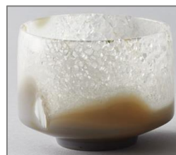
甲州水晶貴石細工(山梨)