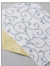
江戸からかみ(東京)