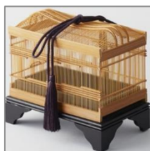
駿河竹千筋細工(静岡)