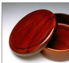
小田原漆器(神奈川)