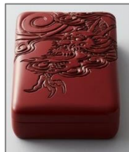
村上木彫堆朱(新潟)