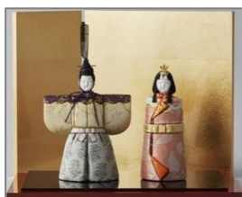
江戸木目込人形(埼玉)