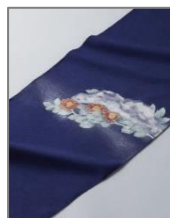
東京手描友禅(東京)