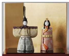
江戸木目込人形(東京)