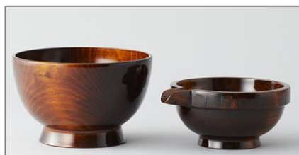
南木曽ろくろ細工(長野)